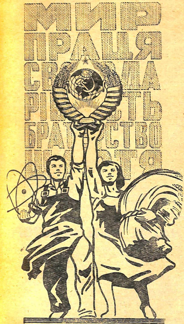
Мал. М. Гуменюка.