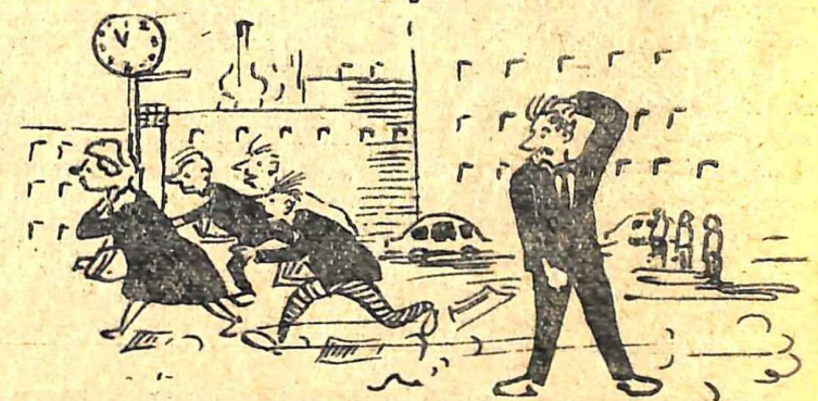
Біля інституту о 8 год. 55 хв. Мал. М. Гуменюка.

такі слова більше підходять до офіційного наказу чи заяви, тільки не до поезії.