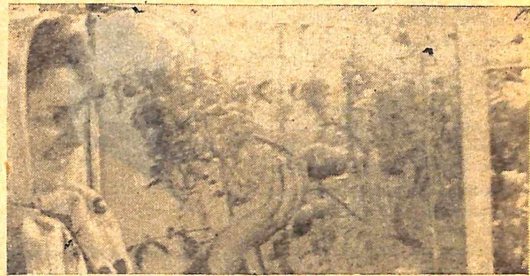
Фотоетюд В. Тимошенка.