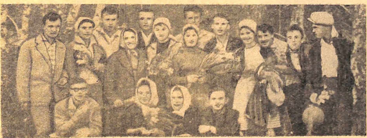
Ось він, загін цілинників нашого інституту.

Герой не погине, умирай, Двойная жизнь ему дана, И эта жизнь его вторая Бессмертной славою полна. Так, герої не вмирають. Вони вічно живуть у ділах і думках наступних поколінь. Ось в таких червоних маках і пожовтілих листах, що зберігають сини солдатів біля своїх сердець.