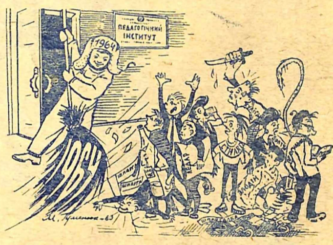
У Новому році вам місця немає!

ВІДВІДУВАЧАМ інститутської їдальні, яка бореться за звання колективу комуністичної праці. Рекомендую: їсти через день — тоді черги у вашій їдальні стануть вдвоє коротшими.