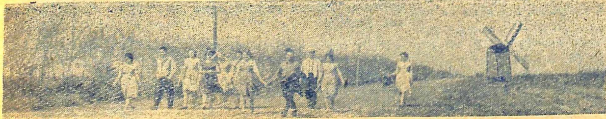
Третьюкурсники-філологи у подорожі по шевченківських місцях