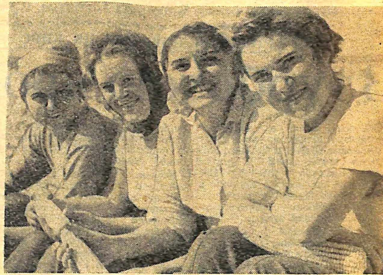
Фото № 2.