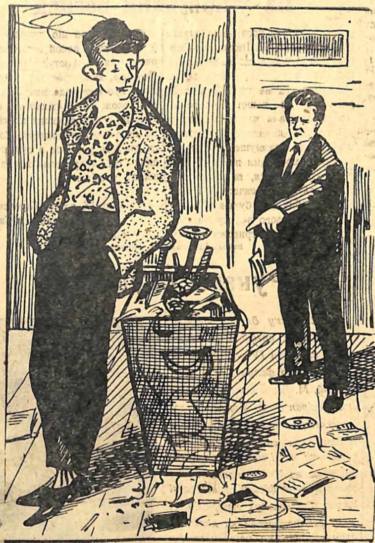
Насмітив — прибері!

Майбутні педагоги! Не забувайте про гігієнічні вимоги при організації навчально-виховного процесу. Будьте прикладом для учнів у всьому!