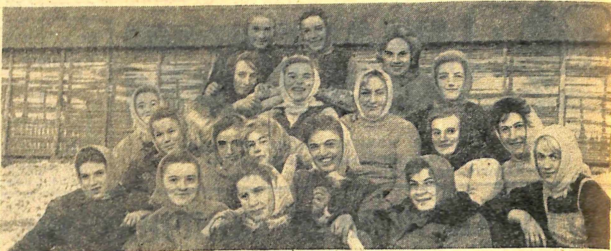
Це студенти 2 групи 3 курсу дошкільного відділу. Вони найкраще працювали на збиранні кукурудзи.

Обком КП України та облвиконком Кіровоградської області від імені всіх колгоспників і робітників радгоспів висловлюють щире подяку студентам і викладачам Київського педагогічного інституту імені Горького за допомогу, яку вони подали на збірний врожай кукурудзи в 1963 році. Ваш славний колектив по праву може пишатися тим, що в декількох десятках мільйонів пудів Кіровоградського хліба, засіяного в засіки Батьківщини, є вагома частка праці студентів і викладачів інституту.