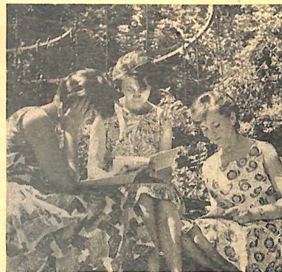
Залишилося кілька годин.